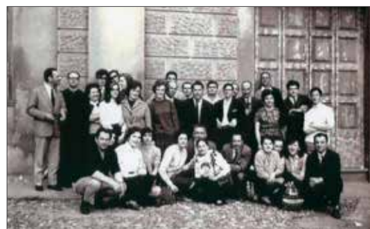
San Carlo Borromeo L'Orchestra a Fiati festeggia i 200 anni dalla fondazione L'Orchestra a Fiati si esibisce in Duomo La Corale cappella del Duomo si esibisce nella cattedrale Un'antica immagine della Corale cappella del Duomo

scomparsa tragicamente. Creata nel 1848, la Scuola ha l'obiettivo di offrire un servizio alla cittadinanza, quello di diffondere la Musica senza scopo di lucro permettendo a tutti di accostarsi fin dalla più tenera età e legando a questo progetto una ben chiara finalità educativa: suonare insieme nel rispetto degli altri e delle regole, musicali e non solo.