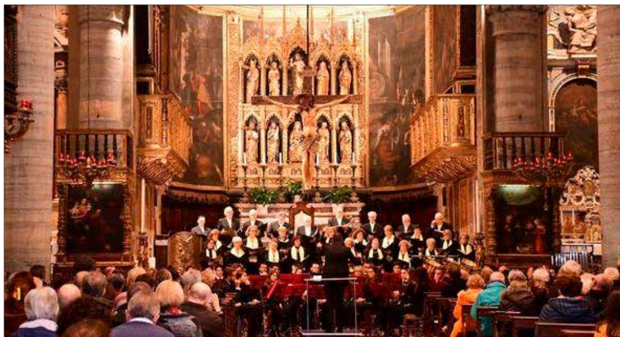
Corale del Duomo Marco Enrico Bossi nel concerto per il Patrono del 4 novembre 2022

la data a cui si può far risalire con certezza la formazione della Cappella Musicale del Duomo di Salò, come risulta dai documenti presenti negli archivi storici comunali. Fra i suoi maestri figurano nomi prestigiosi quali Orazio Vecchi e Giulio Cesare Monteverdi fratello del più celebre Claudio.